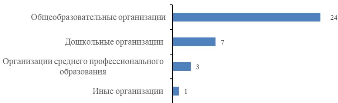
Диаграмма 1. Количество организаций, имеющих статус РИП

Основные направления деятельности РИП в 2024 году сформулированы с учетом федеральных и региональных задач в сфере образования. На отчетный период обеспеченность приоритетных направлений инновационной инфраструктуры в сфере образования Новосибирской области представлена в таблице 1.